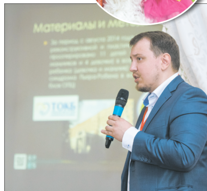
На I Международном научно-практическом форуме по пластической хирургии и косметологии

Все операции в режиме реального времени транслировались из