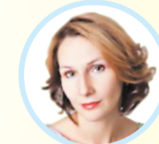
НИИ МЕДИЦИНСКОЙ ГЕНЕТИКИ

И еще пожелаю всем отменного здоровья! И заверяю, что наша клиника всегда готова прийти к вам на помощь в деле сохранения и укрепления здоровья!